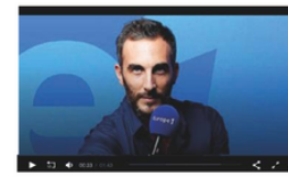
11/10/2018 - "Parler de ce qui m'arrive avait du sens même si un cancer n'a pas de sens"

Europe 1 « Fallait oser » - Interview diffusée le 11/10/18